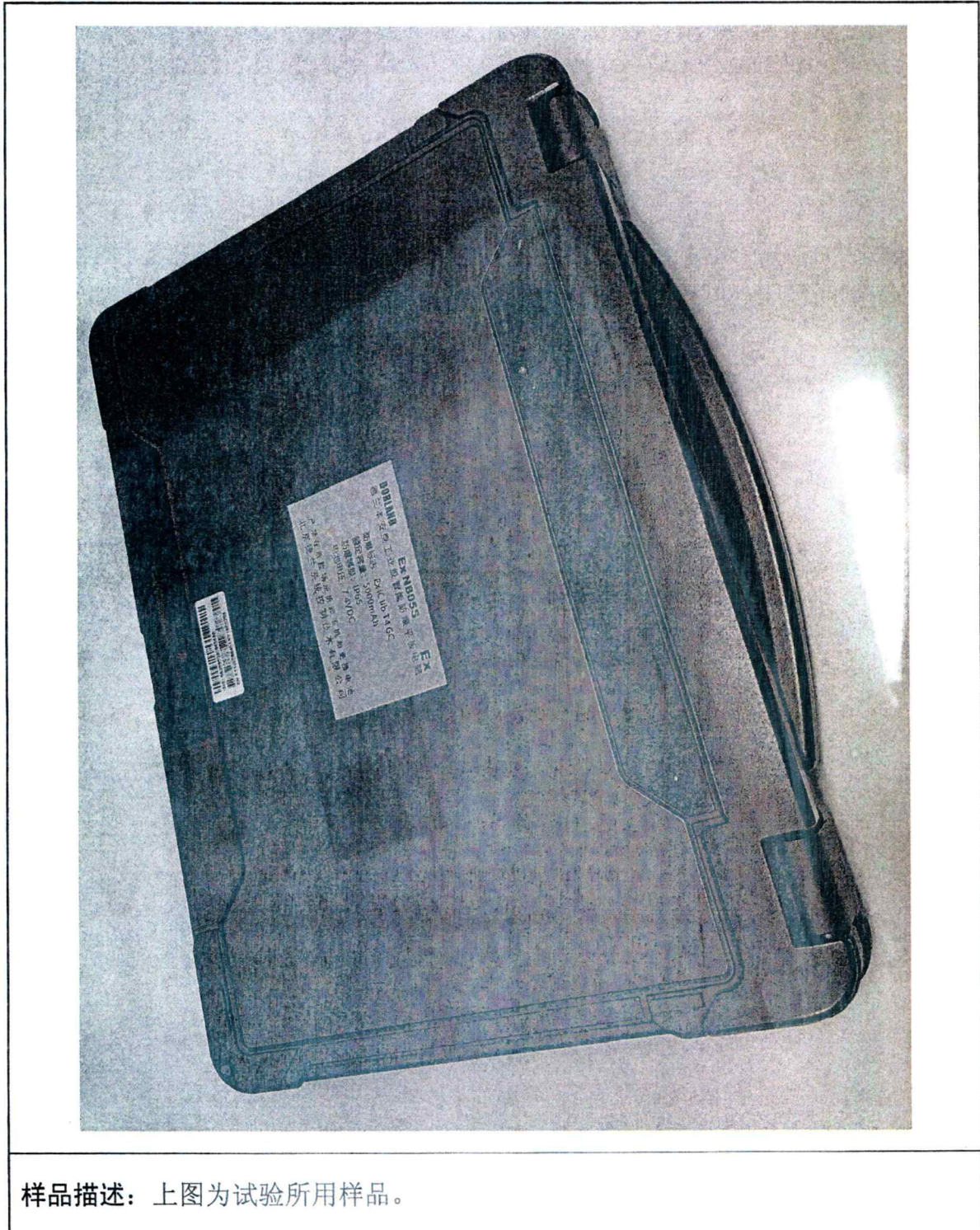
样品描述：上图为试验所用样品。